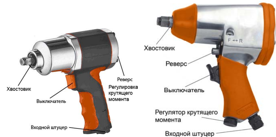
Рис.1 ТЕХНИЧЕСКИЕ ХАРАКТЕРИСТИКИ

Изделие соответствует требованиям нормативных документов Госстандарта России.